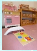
UV-C ブルーライト による玩具の殺菌