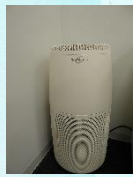
除菌・抗ウイルス対応の 空気清浄器設置

ミライエ3階の事務所では、登録やマッチングに安心して お越し頂けるよう、対策を行っています！