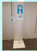
手指消毒アルコール スタンド設置