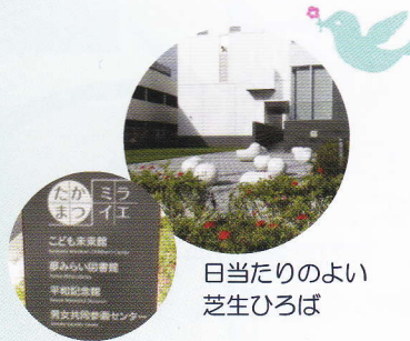
日当たりのよい 芝生ひろば

建物には、こども未来館、夢みらい図書館、平和記念館、男女共同参画センターがあり、それぞれの施設が特色を活かしながら連携することで、子どもから大人まで幅広い世代の人々が多様な関わりをもち、交流とにぎわいを生み出すことを目指しています。